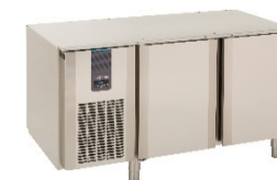
Meuble bas 3 portes ED3